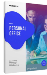
Haufe Personal Office Premium

Erweiterte Fachdatenbank mit Rechtsquellen, Kommentaren und praktischen Arbeitshilfen, z.B. Rechner, Mustertexte und Checklisten