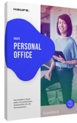
Haufe Personal Office Standard

Sofort verfügbar: In nur 2 Minuten loslegen!