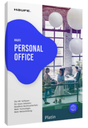
Haufe Personal Office Platin

Umfassende Wissensdatenbank mit digitalen Generatoren und Checks, z.B. Befristungs-Check, Abmahnungs- und Zeugnisgenerator für bis zu 25 Arbeitszeugnisse pro Jahr